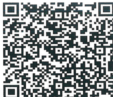
2022年安宁疗护护理实践及新进展研讨班