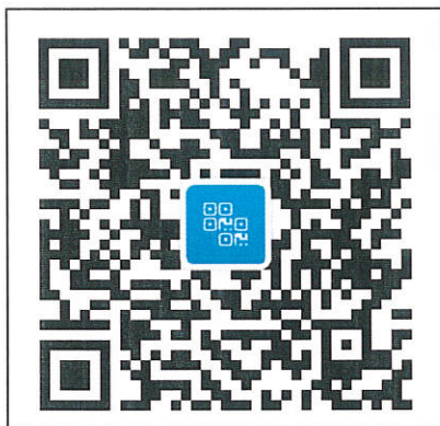
学习班学员二维码